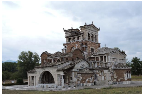
Η Αγία Φωτεινή

Α' μέρος: Πορεία 4.600 μ., Μέτριας δυσκολίας, Υ.Δ. 1090μ. Σ-955μ., Διάρκεια 2+ ώρες, χωρίς στάσεις. Β' μέρος: Πορεία 3.900 μ. Μέτριας δυσκολίας, Υ.Δ. 955μ. Σ880μ. 7985μ., Διάρκεια: 2 ώρες χωρίς στάσεις.