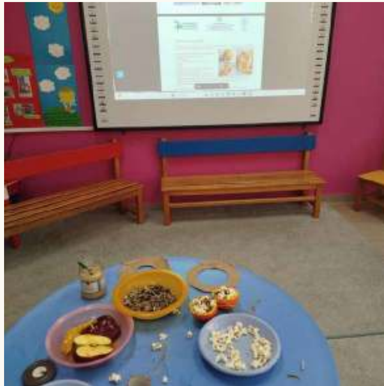
Παίρνουμε ιδέες από το φυλλάδιο της Προστασίας της Φύσης